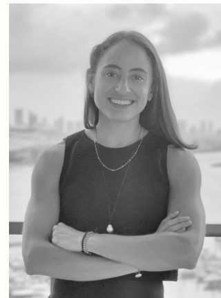
Pau Córdoba @cordobapau